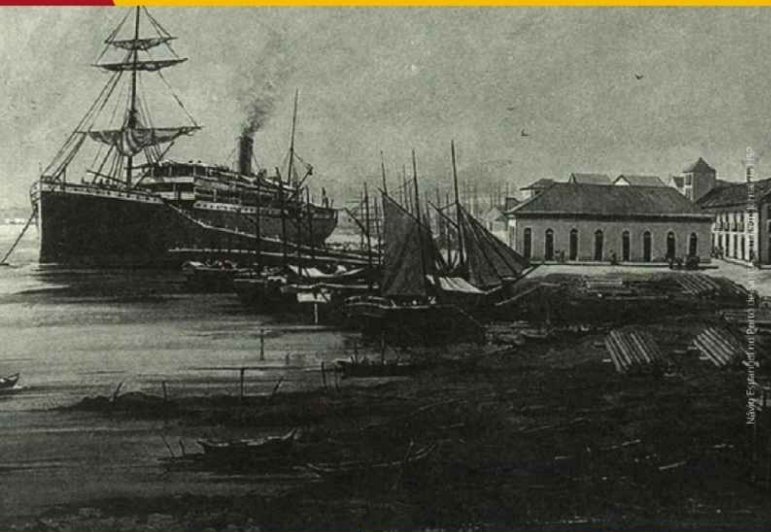
Návio Espanhol no Porto de São Paulo